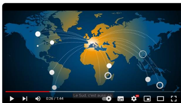
Pourquoi investir en région Sud ?

Découvrez le nouveau film : Pourquoi investir en région Sud ?